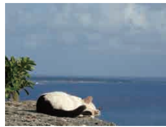
世界の猫の鳴 き声はどうか。 アメリカや欧州 ロシア、中国な どは「ミャウ」 「ミャオ」など M型だ。つまり 沖縄の「ミヤウ ミヤウ」や「ま やー」という呼 び方のほうが国 際的なのだ。

私を含むヤマトンチュ(本土人)には 猫の鳴き声は「ニャー」と聞こえるのだが、 沖縄の友人に確認してみると口を揃えたよ うに「ミャー」だと言う。「猫」を本土で は「ねこ」、沖縄では「まやー」と読む。 このアルファベットの頭文字を取ると本 土はN型、沖縄はM型だとも言える。